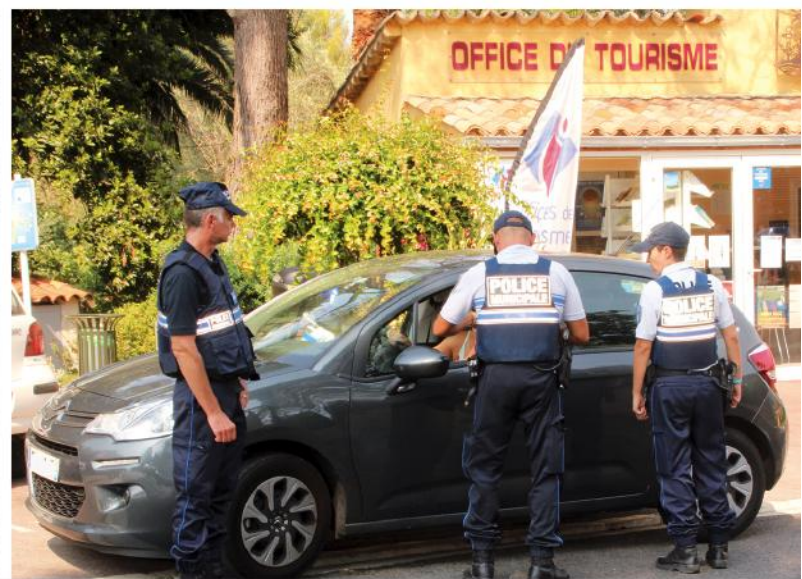
Les gendarmes et les policiers municipaux ne coopèrent pas seulement sur les flots, mais aussi notamment au cours des quadrillages du réseau routier.