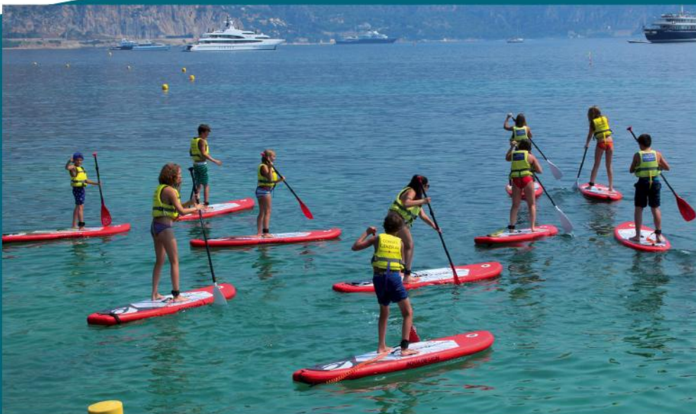
Le Centre de Loisirs du SIVOM en standing paddle

Outre les particuliers, habitants du pays ou touristes qui viennent goûter aux joies des sports nautiques dans la baie de Saint-Jean, le club nautique reçoit régulièrement les groupes d'enfants. Ils sont encadrés par l'École de la Mer, ou par le Centre de Loisirs du SIVOM.