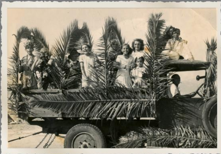
Non nous ne sommes pas dans le désert marocain, mais en plein carnaval dans les années cinquante à Saint-Jean.