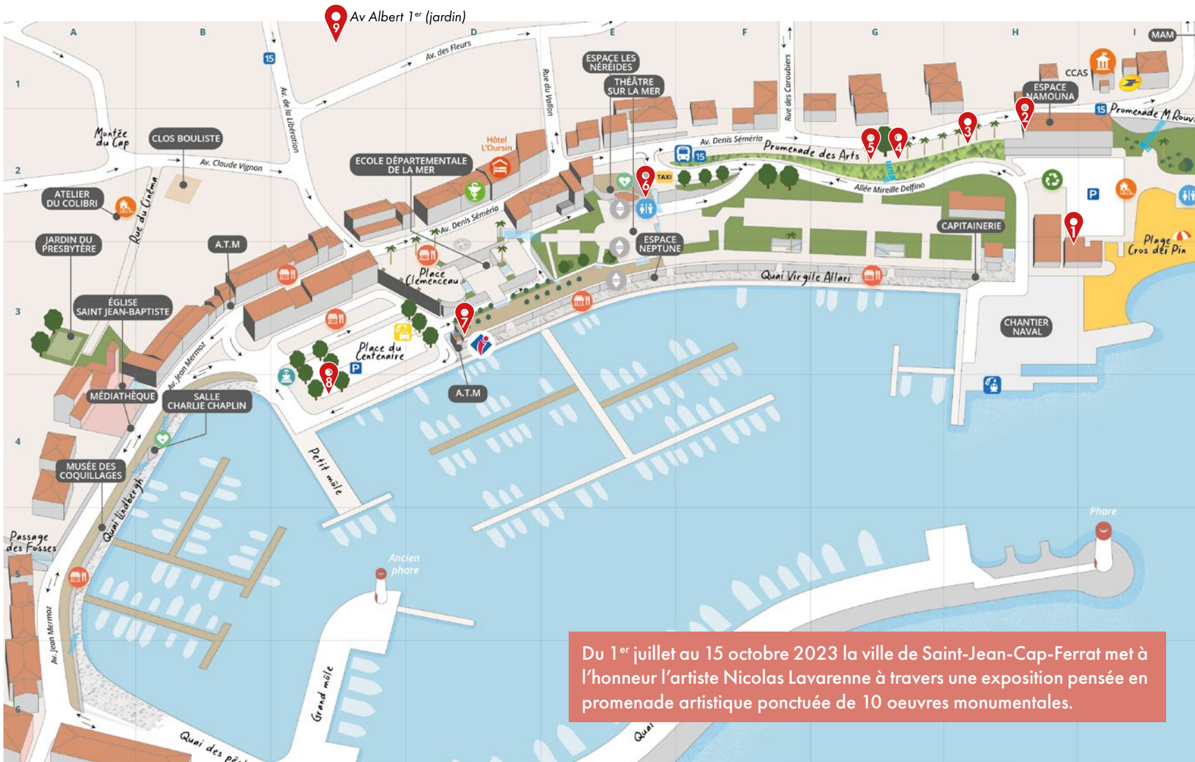
10 Grande Enigme - 600H